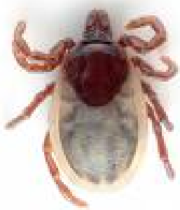
Fotografías incluídas no tríptico corresponden con Ixodes ricinus , unha das especies máis frecuentes en Galicia.