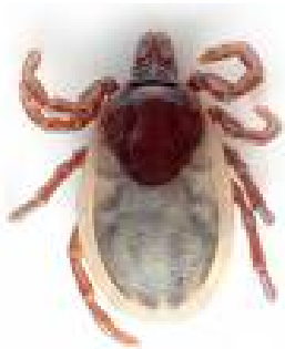
Fotografías incluídas no tríptico corresponden con Ixodes ricinus , unha das especies máis frecuentes en Galicia.